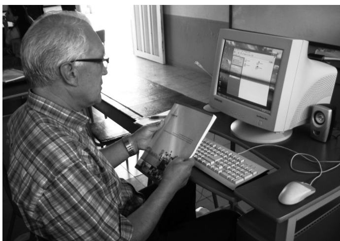
Telecentro en Pradera, Valle del Cauca

Cuando el gremio de artesanos de un municipio da a conocer sus productos a través de, por ejemplo, un blog, se generan procesos de autonomía y apropiación de las TIC, que serían impensables si no se contara con el recurso de participación que ofrece la tecnología Web 2.0.