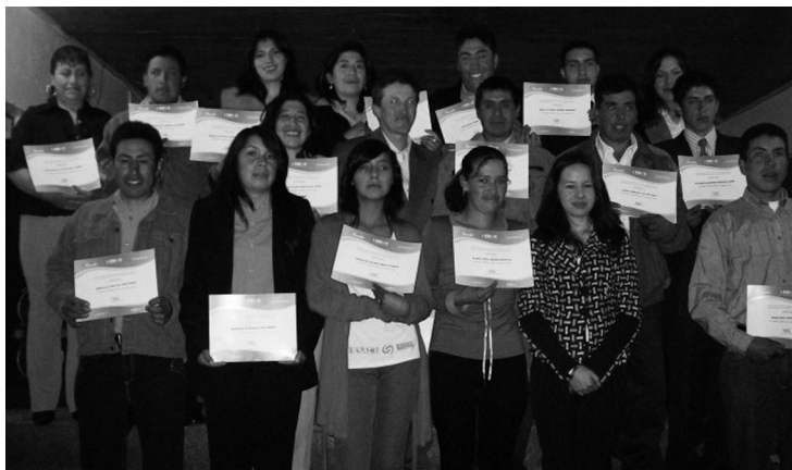
Personas capacitadas en el telecentro de Guachucal, Nariño