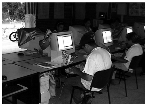
Imagen del Telecentro de Toribío, Cauca

Aunque en apariencia se asemeje a un café internet, el Telecentro está concebido como un espacio de encuentro de los miembros de la comunidad, en el cual se contará con los recursos informáticos como apoyo a la formulación y desarrollo de proyectos sociales, pensados desde la comunidad y para la comunidad.